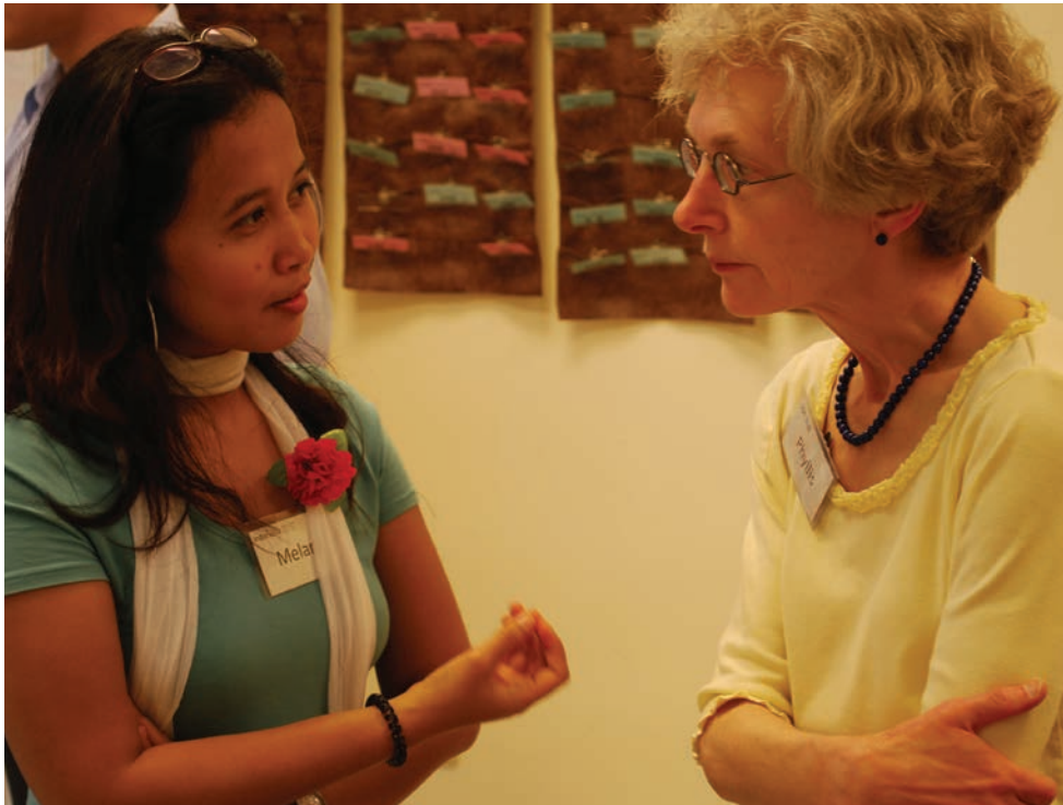
Dos mujeres menonitas conversan entre ellas; una es oriunda de América del Norte y la otra de Indonesia. Para la comunidad anabautista, el CMM es el ámbito donde es posible este intercambio intercultural.

Pablo ofrece una oración para esta iglesia gentil en Efesios 3:14-21. Ora para que puedan entender la inmensidad del amor de Dios: su amplitud, extensión, profundidad y dimensión. Y ora para que puedan conocerlo “con todos los santos”. Me encanta esta pequeña frase. Creo que se refiere a que no podemos conocer verdaderamente la inmensidad del amor de Dios sin todos los santos. Es sólo en el desorden de las diferencias –culturales, lingüísticas, políticas, teológicas y económicas– con todos los santos, que podremos empezar a comprender el amor de Dios. Hace falta una comunidad mundial para empezar a comprender la inmensidad del amor de Dios, y para ser el pueblo que Dios quisiera que seamos.