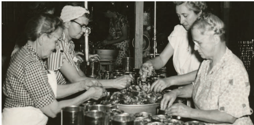
A principios de la década de 1950, mujeres de First Mennonite Church de Bluffton, Ohio, EE.UU., envasan carne para los programas de ayuda humanitaria del Comité Central Menonita para su distribución mundial.

3. Sistemas legales y financieros previsibles en Estados Unidos le han permitido a los anabautistas crear aquí diversas instituciones, ya sean organizaciones misioneras y centros de retiros, o fondos de inversión y hogares de ancianos. La labor de estas grandes instituciones que cuentan con per-