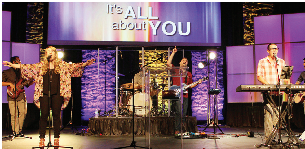
Overflow, una banda de alabanza integrada por jóvenes de las congregaciones de los Hermanos en Cristo de habla hispana, de Miami, Florida y alrededores, toca en un culto de la convención de la iglesia en 2014. Un tercio de todos los Hermanos en Cristo de Estados Unidos habla español.

5. Los anabautistas estadounidenses se vinculan al mundo de muchas maneras. Algunos vínculos se dan a través del trabajo o de la labor del Comité Central Menonita (MCC), la Asociación Menonita para el Desarrollo Económico o los Ministerios Cristianos de Ayuda. Otros vínculos surgen por medio de viajes, adopciones, matrimonio o albergando a estudiantes internacionales. Algunas congregaciones han establecido vínculos fraternales con congregaciones menonitas o de los Hermanos en Cristo de otras partes del mundo. Los anabautistas estadounidenses tienen mucho que aprender de la familia mundial de fe. Que la próxima Asamblea, Pennsylvania 2015, permita que se establezcan y prosperen aun más vínculos.