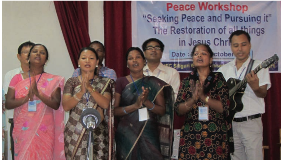
Un grupo musical se presenta en uno de los talleres realizados en la India y Nepal, para cristianos y cristianas anabautista-menonitas y Hermanos en Cristo.

Durante nuestra visita, observamos que muy poca gente conocía el CMM. (Las personas que sí lo conocían, habían asistido a la Asamblea del CMM en Calcuta, en 1997.) Comenzamos nuestra explicación partiendo del contexto local y pasando luego al mundial. Mediante estadísticas y fotografías explicamos la labor del CMM y cómo vincula las convenciones de todo el mundo a fin de fraternizar, adorar, testificar y servir. Conforme hablábamos, fueron prestando atención y mostrando aún mayor interés. Las personas que escuchaban se alegraban al enterarse de que pertenecían a una