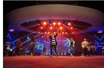
Organice una "reunión para ver la Asamblea" con su congregación, familiares o amigos.

Siguiendo el tema principal de la Asamblea, siguiendo a Jesús juntos superando las barreras, cada día se enfoca en una faceta diferente de seguir a Jesús.