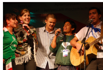
Aprenda sobre el trabajo del CMM.

Para facilitar la participación en todo el mundo, los talleres en línea se llevan a cabo de 06:00 a 07:30 y de 00:00 a 1:30, hora de Semarang. Para obtener ayuda para convertir la hora de Indonesia a su zona horaria, busque la hora de Semarang en Google para averiguar la hora exacta en Semarang.