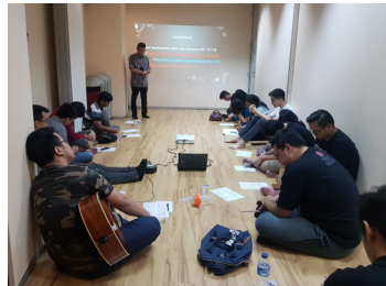
Participe de los diferentes talleres cada día.