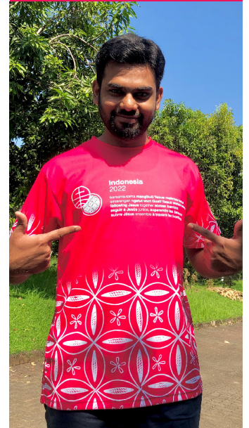
Muchas oportunidades de servicio.

Para facilitar la participación en todo el mundo, los talleres en línea se llevan a cabo de 06:00 a 07:30 y de 00:00 a 1:30, hora de Semarang. Para obtener ayuda para convertir la hora de Indonesia a su zona horaria, busque la hora de Semarang en Google para averiguar la hora exacta en Semarang.