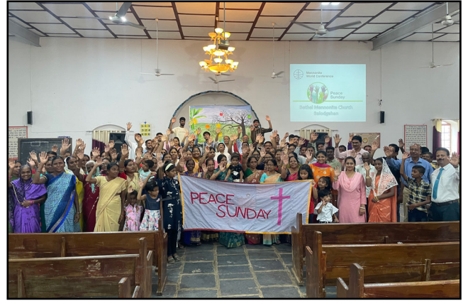
La Iglesia Menonita Bethel de Balodgahan, India, celebra el Domingo de la Paz de 2022.

Comparta su historia y foto con la familia mundial anabautista, enviándolas con la autorización correspondiente a: photo@mw-cmm.org