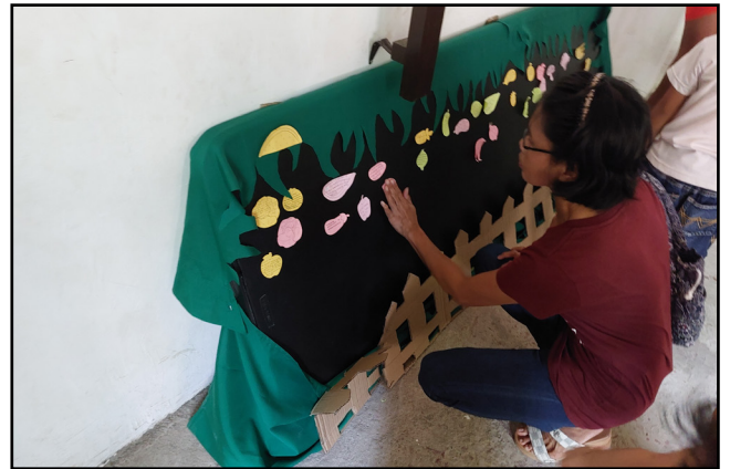
La Iglesia Bíblica Menonita Lacao de Lumban, Laguna (IMC - Filipinas) celebró el Domingo de la Paz en 2022, cantando canciones internacionales y creando el jardín de la paz (actividad sugerida en los recursos para el culto), donde los miembros escriben "cómo podemos tener un impacto en la comunidad" sobre las frutas y verduras.